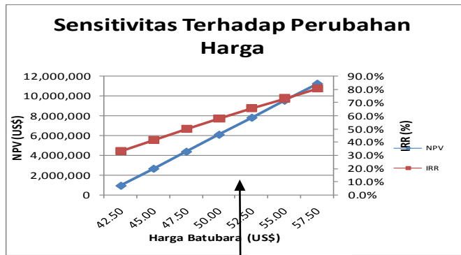
Gambar 4.3 Sensitivitas Terhadap Perubahan Harga Batubara