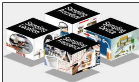
Gambar A.1 Kasifikasi sampling